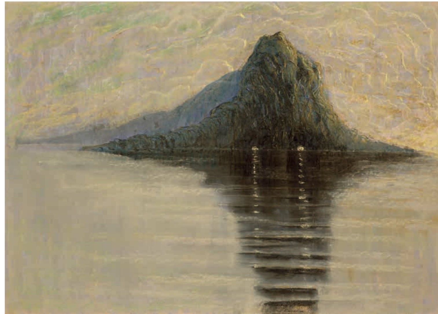
Ramybė , 1904 / 1905. Popierius, pastelė, anglis (?), 54 × 74 [51] Serenity , 1904 / 1905. Pastel, charcoal (?) on paper, 54 × 74 [51]