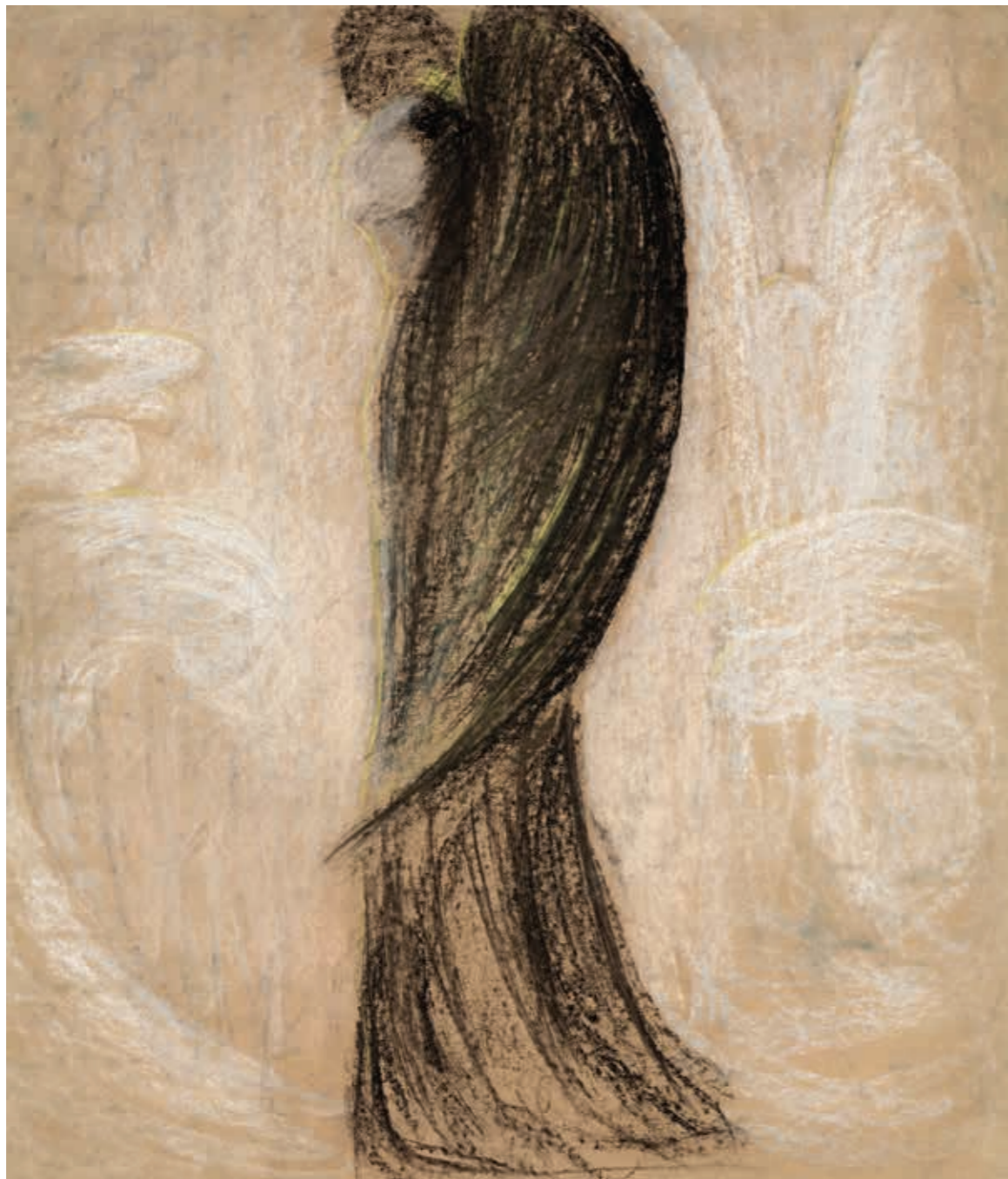
Angelas , 1904 / 1905. Popierius, pastelė, 73,2 × 62,5 [37] Angel , 1904 / 1905. Pastel on paper, 73.2 × 62.5 [37]