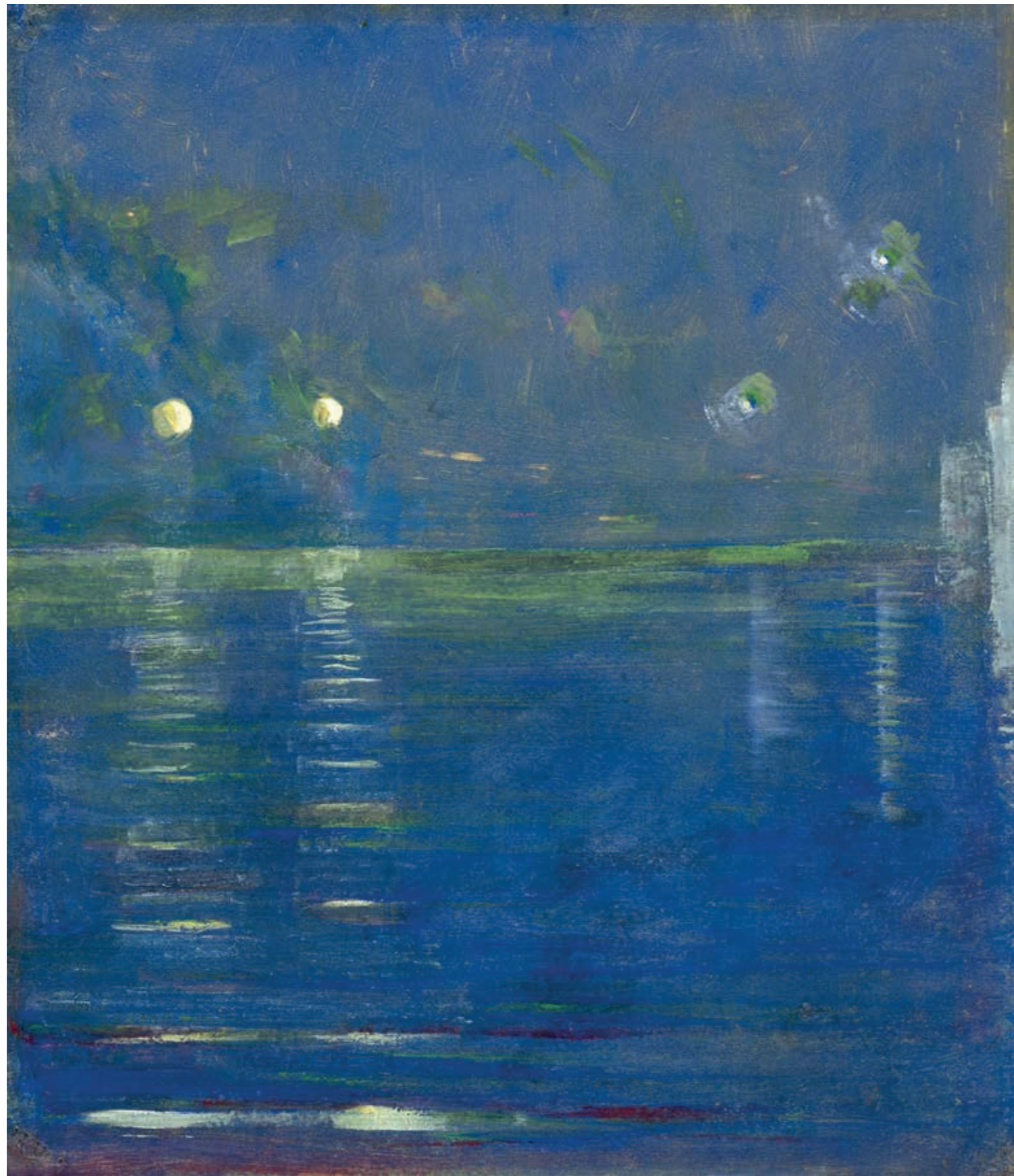
Pasaulio sutvėrimas. V iš 13 paveikslų ciklo, 1905 / 1906.