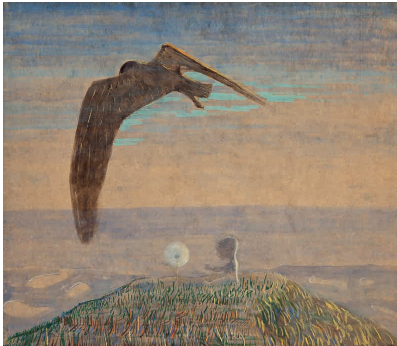
Pasaka. II paveikslas iš triptiko, 1907. Popierius, tempera, 62,2 × 71,9 [132] Fairy Tale. II from the triptych, 1907. Tempera on paper, 62.2 × 71.9 [132]